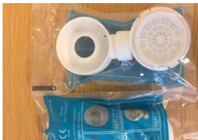
Filter REF: 828-0042 og 828-0049 Skiftes for hver gang