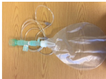
Utåndingsbag REF: 2612002 En-pasients, kan brukes flere ganger