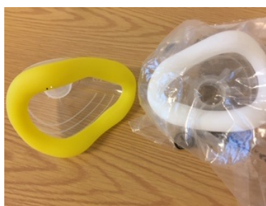
Gul maske (nr 4) til ungdom REF: 7093000 Hvit maske (nr 2) til barn REF: 7092000 En-pasients, kan brukes flere ganger. Flergangsmasker passer også til utstyret